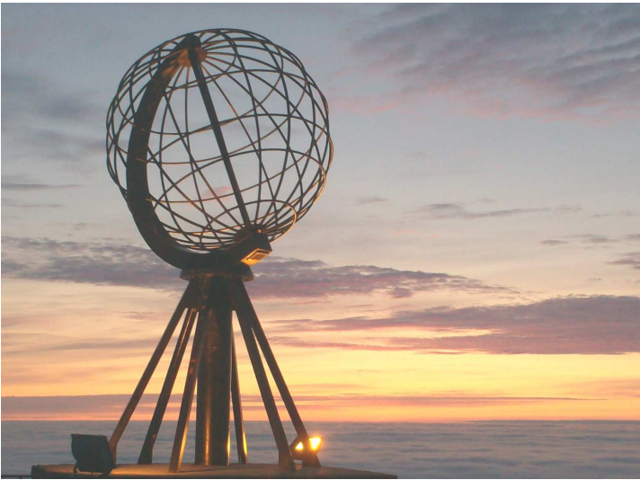
il Globo alle 2 di notte