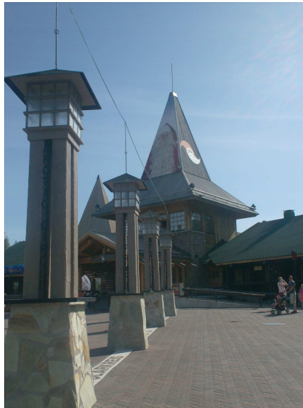
Ufficio di Babbo Natale

La giornata comincia con la scoperta che in Finlandia hanno l'ora diversa dalla nostra, sono un'ora più avanti! E' strano essere circondati di decorazioni natalizie, ascoltare jingle bells ed essere in pantaloni corti!