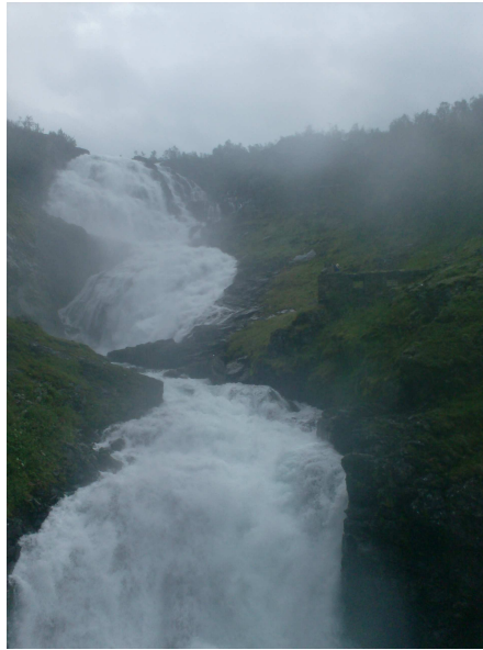
cascata sulla Flamsbana