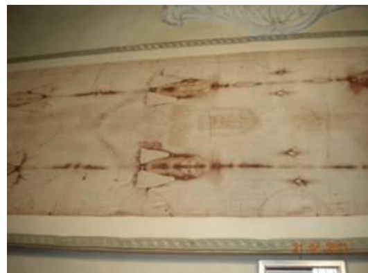
la sacra sindone