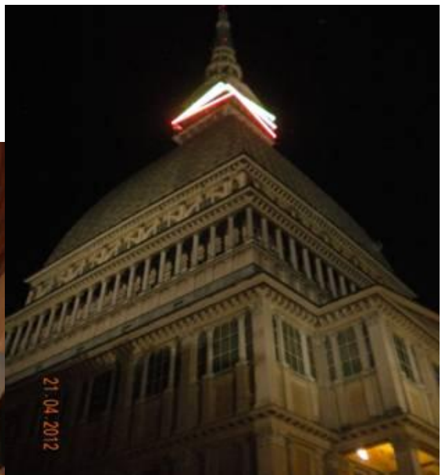
mole by night