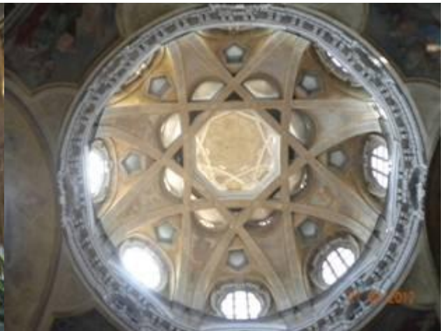
chiesa di san Lorenzo