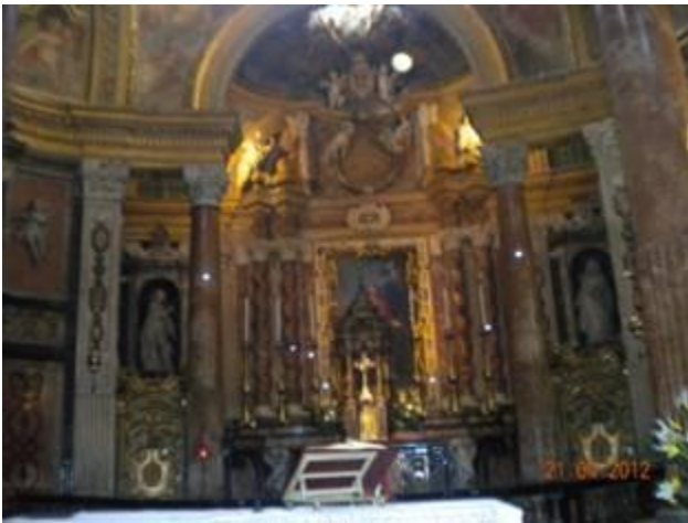
chiesa di san Lorenzo