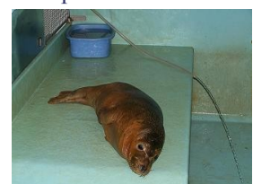
foca in cura

Con la 82 finiamo di costeggiare il bellissimo Loch Lomond che si va via via sempre più restringendo,poi con la 85 ci si porta ad Oban. Ci accompagna un paesaggio montano,la strada è tranquilla ma lenta,le Glen ( valli) sono stupende,tocchiamo il Loch Awe e quindi Oban ,pk:(56°25'09 N 5°28'28 W ). La cittadina è animata,qui compero le mascherine per l'eventuale difesa dai micidiali midge che pungono prevalentemente sul cuoi capelluto e sulle orecchie. Si pranza a base di Fish and Chips,si visita la distilleria di whisky single malt,Oban Distillery( nata nel 1974),poi con la 828 verso Fort Williams. Dopo Oban in corrispondenza del Connel Bridge riusciamo a vedere le Falls of Lora spettacolari rapide che si riversano dal Loch Etive su una cornice rocciosa quando cala la marea. Sempre sulla 828 a Barcaldine ci fermiamo allo Scottish Sea Life Sanctuary e visitiamo questo centro ( 10.95 £ a pers.) dove vengono curati i cuccioli di foca orfani ed inoltre si trovano altre specie ittiche. Costeggiamo quindi il Loch Linnhe fino a Fort William con la 82 e qui ammiriamo il sistema di chiuse che permettono la navigazione sul Caledonia Canal. In questo momento però sono ferme. Le chiuse formano una “scala” e le imbarcazioni passano quando,una volta aperta la prima,l'acqua viene fatta defluire e trattenuta