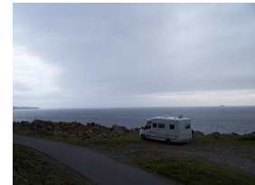
Sosta a Skye