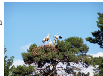
Le cicogne di Rouffach

vicino al lago poi,attornati da malghe e prati in fiore scendiamo per riprendere l'autostrada: Lucerna, Basilea,Mulhouse e qui usciamo per andare a Rouffach,borgo pittoresco popolato di nidi di cicogne. Sostiamo per la notte in un parcheggio vicino ai campi sportivi ( 47°57'16 N 7°17'41 E ) in compagnia di tre simpatici camperisti veronesi.