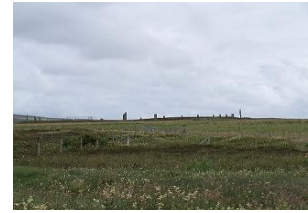
Ring of Brodgar