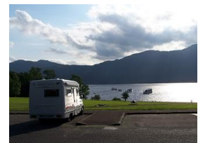
sosta a Tarbet

Stamattina ci sono 14°,c'è il sole e noi si torna a Carlise e con la E18 si entra in Scozia a Gretna. Proseguiamo fino a Castle Douglas dove andiamo a visitare la “Sulwath Brewery” una piccola ma interessante birreria dove si può vedere il tradizionale procedimento utilizzato per produrre la birra tramite una visita guidata alle h.13.00 ( 3,50 £ a pers. compresa una mezza pinta di birra) in inglese. Buone la Knockendock e la Criffel. Il mezzo lo si può parcheggiare nel pk in centro ( 54°56'32 N 3°55'37 W ). Acquistiamo della birra e dopo aver fatto quattro chiacchiere con gli ospiti della birreria prendiamo la 713 verso Ayr. Costeggiamo il Loch Ken e ci immergiamo nel verde di questa regione dove si trova il Galloway Forest Park. Purtroppo non c'è il tempo di fermarsi a lungo,continuiamo verso Glasgow e con la 82 costeggiamo il Loch Lomond,il più grande lago della Gran Bretagna continentale. Questo lago presenta dei paesaggi mutevoli salendo verso nord,tutti molto belli. Ci fermiamo a Luss villaggio caratteristico per le entrate delle case ricoperte da piante di rose,ma passeggiando, notiamo che i pk hanno tutti il solito “no overnight”. Si continua quindi fino a Tarbet dove pernottiamo al porto turistico ( 56°12'10 N 4°42'35 W ) libero da divieti.