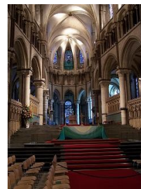
Cattedrale di Canterbury