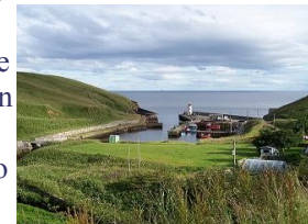
Faro di Lybsten

Ci svegliamo con la nebbia ed una temperatura di 12°, ci rechiamo a John O'Groats fermandoci per strada ad osservare i curiosi bovini delle Highlands, con il pelo e dall'aspetto che sembra minaccioso, ma in realtà molto mansueti. Tappa al faro di Duncasby Head dove vige il divieto di sosta notturna e via verso Wick con la 99, esce il sole e ci si ferma al faro di Wick prendendo la deviazione per Staxigoe, ottimo punto anche per un'eventuale sosta notturna. Noi invece continuiamo fino a Lybster. La costa è bella, le colline ricoperte di erica sembrano gettarsi direttamente nel mare e le numerose pecore formano delle chiazze bianche sulle pendici. Ci fermiamo in un bel porticciolo (58°17'45 N 3°17'27 W) sotto Lybster inserito tra rocce erbose ricche di insediamenti di gabbiani e le loro grida unite al suono della risacca del mare ci fanno addormentare dolcemente.