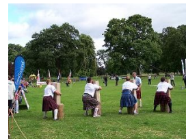
I giochi- Highlander Challenge

Dopo le premiazioni di rito,verso sera riprendiamo la strada e percorriamo la costa del Firth of Tay da Newburg a Tayport. Il sole illumina l'acqua e la campagna con il suo colore vicino al tramonto e sembra donare a tutto una tinta dorata,rendendo la natura attorno a noi spettacolare. Le strade sono strette,ogni tanto sbagliamo,ma questa parte della penisola del Fife è splendida,e va percorsa con calma. Si va a pernottare a Tayport,al porto ( 56°27'04 N 2°52'52 W).