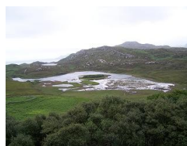
paesaggi scozzesi della costa settentrionale