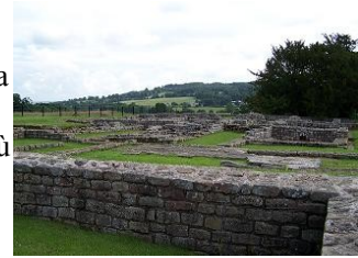
fortezza romana Chesters

fermo il mezzo al camping e ci dirigiamo alla fortezza romana di Chesters. Qui le rovine,ben conservate, sono immerse nel verde,tra prati e boschi e la visita è interessante ( 3,80 £ a pers.). Dopo,dato che è ancora presto pensiamo di percorrere qualche km a piedi lungo il vallo tra prati,boschi e le solite pecore. Più tardi riprendiamo il bus e, ritornati al camping ,decidiamo di fermarci un'altra notte in compagnia di un paio di ragazzi in tenda. Nei vari siti lungo il vallo di Adriano ho notato dei pk per camper ,ma con il solito divieto di sosta notturna. Le strade sono strette ma percorribili con calma. La sera si va a cenare all'unico ristorante del villaggio all'Hotel,locale tipico,molto accogliente e con buona cucina.