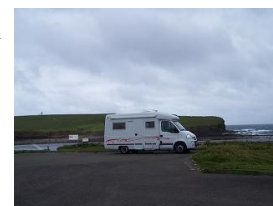
Sosta a Birsay