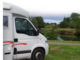
Sosta a Callander

Sosta a Callander,passeggiata sul fiume,giretti in paese dove trovo un negozio di addobbi natalizi e mi rifornisco,insomma un dolce far niente.