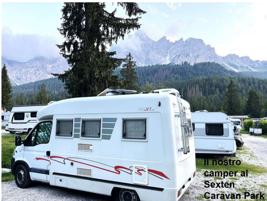
Il nostro camper al Sexten Caravan Park

Controlliamo il percorso che vogliamo fare domani alla Val Fiscalina e scopriamo che coincide con l'inizio del sentiero 102 che arriva al Rifugio Locatelli, ma con un dislivello di quasi 1000m (!). In realtà, poco dopo il rifugio Fondovalle c'è un bivio, dove è possibile intraprendere un anello che passa per il Rifugio Comici, Pian di Cengia, Locatelli o viceversa, ma è molto impegnativo per