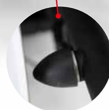
Protezione stabile dai danni alle porte posteriori.