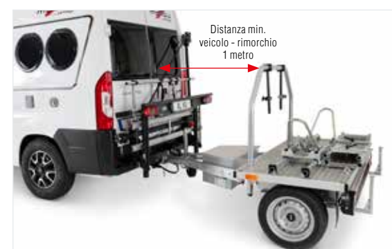
Gancio di traino utilizzabile senza limiti