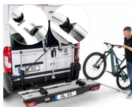
Facile da caricare, anche con una rampa.