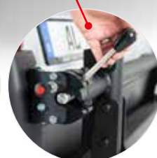
La serratura può essere bloccata con un lucchetto disponibile come optional