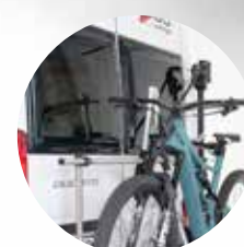
Spazio sufficiente anche per bici più grandi.