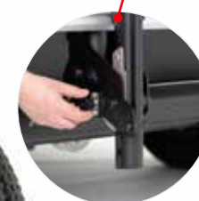
Messa in sicurezza con un sistema di blocco facile da usare