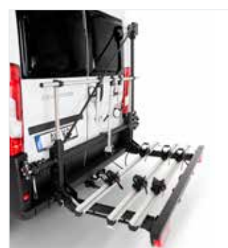
Set di allestimento per 3 e-bike o biciclette