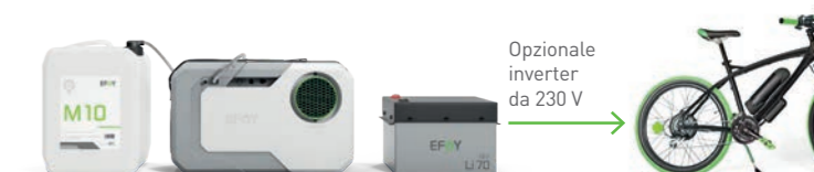
Cartuccia + Pila a combustibile + Batteria