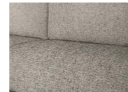
Saros (di serie)