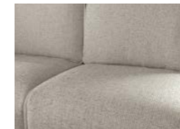
Heron - con applicazioni in similpelle (optional)