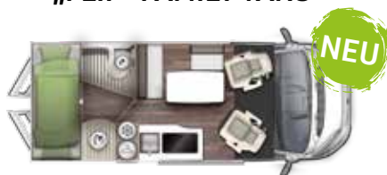
V 599 VB "FLIP"