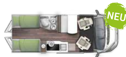
V 636 EB "FLIP"