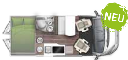
V 599 HB "FLIP"