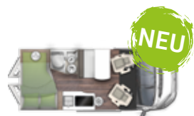
V 541 HBL