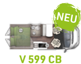
V 599 CB